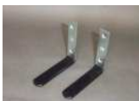
PS-181 Rovné podpurné držáky deionizační náplně