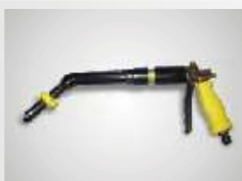
GUN-X Plnicí pistole pro přesné doplňování hladiny elektro- lytu v trakčních bateriích