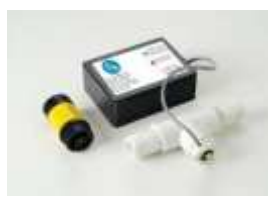
PS-160 DC LED kontrolka čistoty napájená z baterie, vsazená v T-spojce