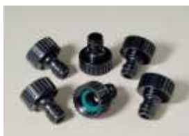
ACC-037 Sada rychlospojek M x F "závit", 6 ks