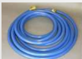
PS-150 Výstupní modrá hadice, 6 m