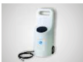
000320956 Zásobník na deionizovanou vodu