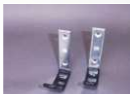
ACC-035 Hákový držák hadice, 2 ks