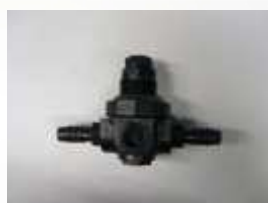
ACC-061 sada omezovače tlaku na 15 psi, tedy 1,034 bar s napájecími kolíky