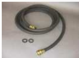
PS-140 Vstupní černá hadice, 3 m