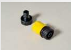
PS-122 Sada rychlospojek, po jednom kusu ACC-034 a ACC-037