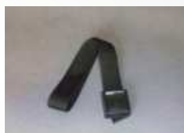
PS-170 Upevňovací páska pro fixaci náplně deionizátoru k zadní žluté desce