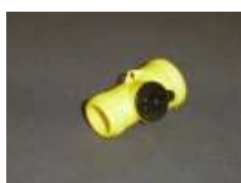
PS-190 Omezovač průtoku, 1.9 l/min samčí/samičí závit pro plnění zásobníku