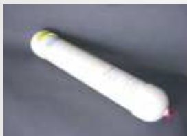
obj. č. 000320953 Náhradní deionizační náplň