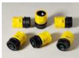
ACC-034 Sada rychlospojek F x F "závit" se zadržovacím ventilem, 6 ks